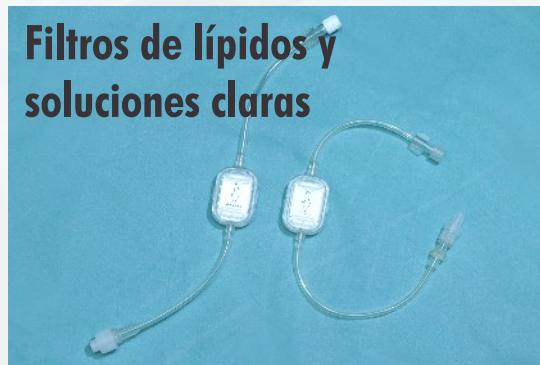
Filtros de lípidos y soluciones claras

Sistemas integrados cerrados aptos para diversas bombas