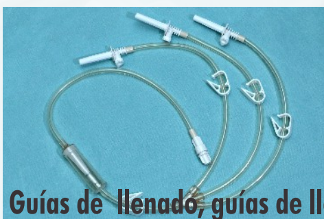
Guías de llenado, guías de llenado para bombas