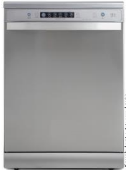
*Fotografía ilustrativa. Varía según el modelo